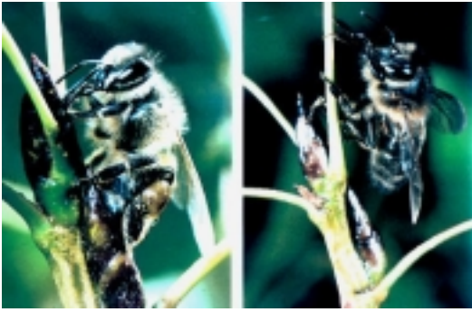
Biene sammelt Propolis von Knospe